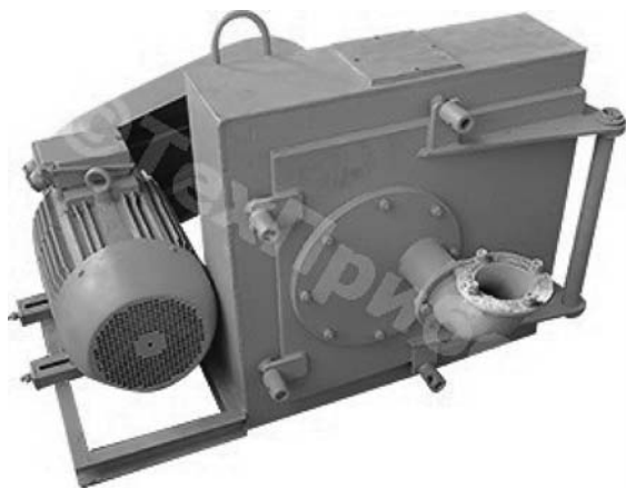
Рис. 1. Импеллерная мельница «МИКРОКСЕЛЕМА»

Оригинальная конструкция импеллера и статора мельницы позволяют создать две практически независимые области измельчения. Первая, с увеличенными рабочими зазорами для предотвращения поломок рабочих органов, связанных с попаданием в камеру помола недробимых включений, а вторая, напротив, с малыми