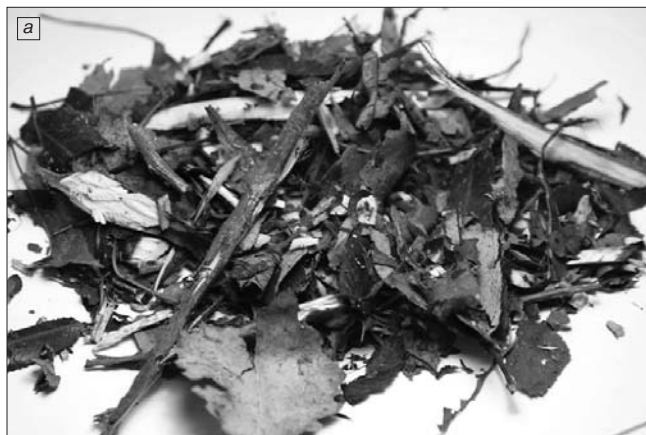
Рис. 2. а – исходный материал – опилки, сучья, ветки \varnothing 30 мм, длина до 20 мм; б – материал после измельчения на импеллерной мельнице «МИКРОКСЕЛЕМА»