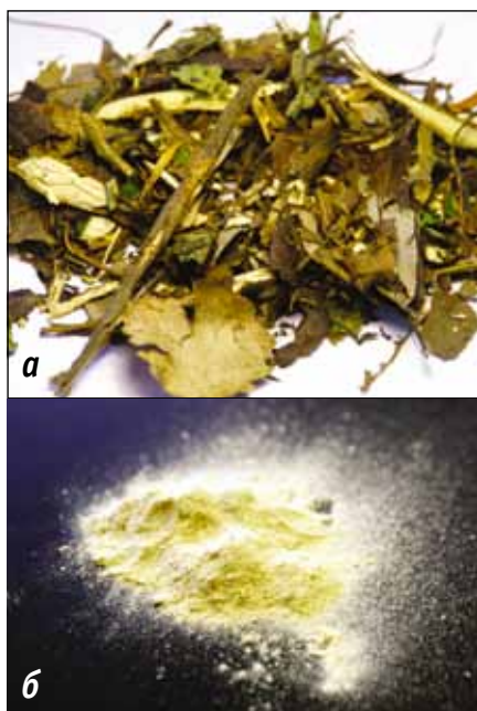
Исходный материал (опилки, сучья, ветки диаметром до 30 и длиной до 20 мм) (а) и материал после измельчения на импеллерной мельнице «ИМ-450» (б)

Оригинальная конструкция импеллера и статора мельницы позволяют создать две практически независимые области измельчения. Первая область имеет увеличенные рабочие зазоры для предотвращения